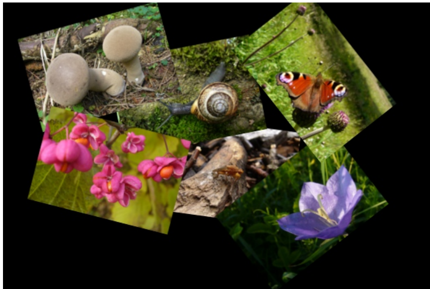
Ilustrace 3: Výsledek cvičení

Vytvoř koláž z vrstev v pracovním souboru.